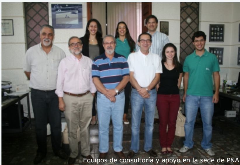
Equipos de consultoría y apoyo en la sede de P&A

La exposición internacional de sus ejecutivos durante los pasados 18 años se ha convertido en un importante activo que P&A progresivamente puso a la disponibilidad del sector café. El conocimiento acumulado por P&A ha sido muy buscado por los principales eventos cafetaleros alrededor del mundo durante los últimos 15 años y está muy relacionado con Carlos Brando, socio de la firma. Pero P&A no sólo se trata de presentaciones en conferencias y Carlos Brando. El equipo de P&A ha estado ofreciendo servicios de consultoría por mucho tiempo a clientes tan diversos como el Banco Mundial, la Organización Internacional del Café, compañías privadas y gobiernos en países como USA, México, Colombia, e India, además de Brasil. Los clientes internacionales se han aprovechado de las competencias y conocimientos de P&A en mercadeo, estrategia y tecnología así como de su singular metodología para buscar consenso estratégico en ambientes organizacionales complejos, para apoyar el proceso de toma de decisiones y entender y aprovechar las tendencias de mercado.