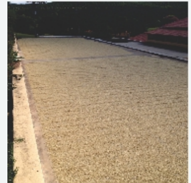
Cosecha temprana y procesamiento de Bourbon Amarillo en la Finca Santana, región Mogiana del estado de São Paulo