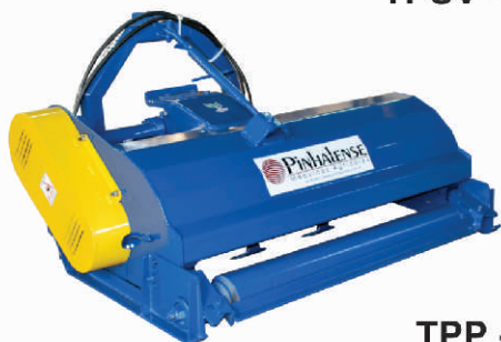
TPP - 160