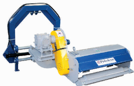
TPSV - 090

Algunos modelos de la línea de desmalezadoras Pinhalense pueden ser vistos en operación en www.youtube.com/Coffidential .