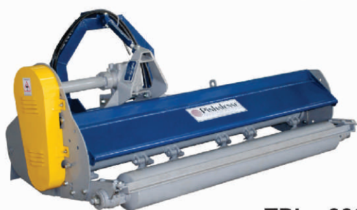
TPL - 220