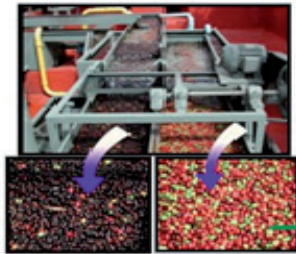
LSC Mechanical Siphon

长期在印度近年来在乌干达做水洗罗布斯塔咖啡、现如今在巴西做蜜处理康尼隆咖啡的长期经验表明，水洗罗布斯塔可以获得高达30%甚至更多的价格溢价。皮亚兰斯（Pinhalense）鲜果加工设备 - 机械清洗机（即机械虹吸）LSC、脱皮机ECO SUPER和脱胶机DMPE - 可以从罗布斯塔咖啡中获得最佳品质，无论它们是如何采收的。