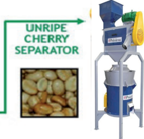
ECO SUPER Pulper