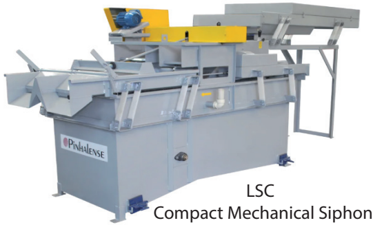
LSC Compact Mechanical Siphon

大多数罗布斯塔咖啡鲜果 - 未成熟的、成熟的和过熟的 - 在采收后都会一起日晒处理。这样的加工处理会错过避免咖啡缺陷的好机会。含水量在40%至60%之间的咖啡鲜果被放在一起同时干燥，且通常比技术上建议的干燥速度快些，其结果明显是最终产品干燥不均匀。更糟糕的是，未成熟的和部分成熟的鲜果在这个过程中往往会变成黑豆。避免不均匀干燥和黑豆的一个简单方法是使用机械虹吸，这是一款由Pinhalense发明并获得专利的机器，可以将过熟的和部分已干燥的鲜果从未成熟的和成熟的鲜果中分离出来。这两组鲜果中的每一组具有非常不同的水分含量，应该分别在阳光下或机械上干燥，以节省劳动力和燃料并避免黑豆。