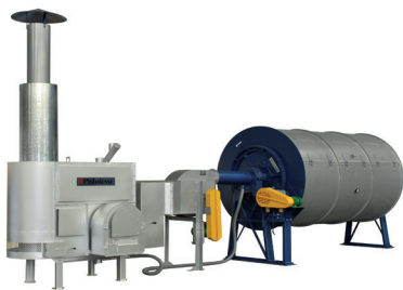
FTD heat exchanger and SRE drier

快速干燥和/或使用立式或静态干燥机（这些机器不能很好地在咖啡中分散热量），会导致咖啡的最终水分不均匀，使咖啡豆过度干燥或干燥不足。过度干燥的咖啡在脱壳时可能会破碎，而干燥不足的（“湿”）咖啡豆在储存时可能会发酵。此外，使用不干净的混有烟雾的热空气会将不必要的气味转移到咖啡豆上。避免黑豆、碎豆和发酵豆的一个简单方法是使用Pinhalense的SRE旋转干燥机和热交换器。干燥速度可以在皮亚兰斯（Pinhalense）旋转干燥机上完全控制，该干燥机在确保最终产品均匀干燥的过程中为所有咖啡提供相同的热量。使用Pinhalense燃油效率高的FTD热交换器可以避免咖啡豆中产生不必要气味的风险。