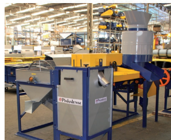
DMPE Mucilage Remover